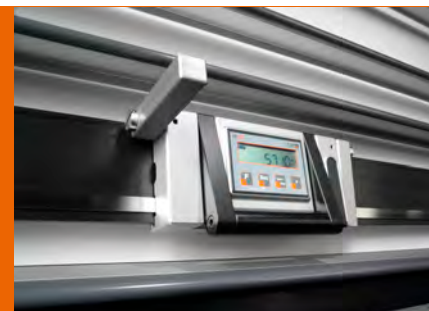
Battuta orizzontale digitale dalla lettura semplice ed immediata