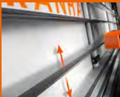
Sollevamento elettronico della spalliera