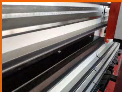
Movimento supporto pannelli automatico