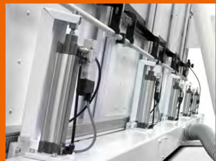
Sistema di aspirazione ottimizzato e gestito pneumaticamente